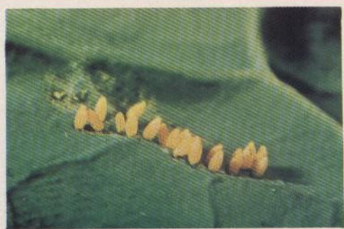
"Huevos de mariquita"