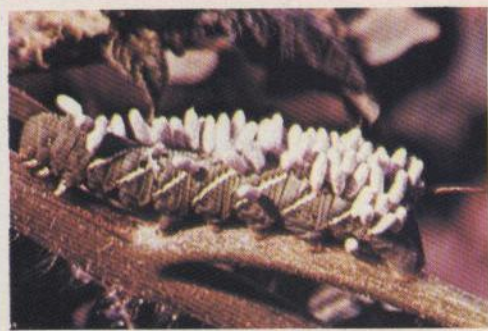
"Capullos de avispitas sobre una larva de mariposa"