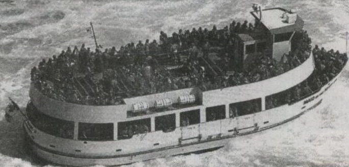
Uno de los barcos "Doncella de la Niebla"

Pero el verdadero origen de las cataratas del Niágara sucedió hace unos 10 mil años. Se calcula que en ese tiempo terminó la última gran glaciación. El clima cambió y se hizo más caliente. Entonces poco a poco los hielos que cubrían toda esa región empezaron a derretirse. Se formaron unos grandes lagos cuyo desaguadero formó este río. El agua desde entonces ha ido desgastando y profundizando el cauce del río, formando así las cataratas más famosas o más conocidas del mundo.