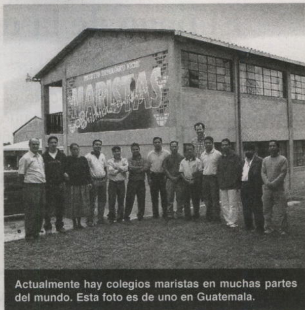
Actualmente hay colegios maristas en muchas partes del mundo. Esta foto es de uno en Guatemala.

Marcelino era muy devoto de la Virgen María y llamó al grupo de maestros La Sociedad de María. Con el tiempo, la gente llamó a esos maestros los Hermanos Maristas y sus escuelas llegaron a ser famosas y respetadas. Sin embargo, Marcelino nunca perdió