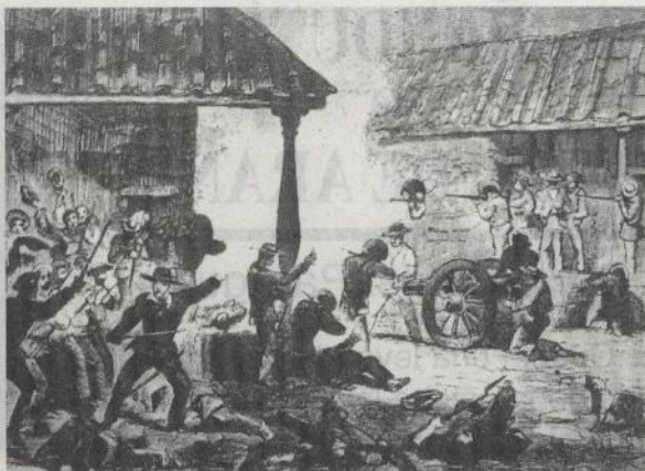
Batalla en la ciudad de Rivas.

Diciembre de 1856. Tropas de Costa Rica controlan el río San Juan, impidiendo que por el Océano Atlántico lleguen barcos con refuerzos que los amigos de Walker le enviaban desde los Estados Unidos.