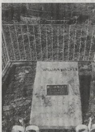
La tumba de William Walker en Trujillo.

Pero la obsesión de Walker por Centroamérica sigue viva. Unos tres años después desembarca en Honduras con unos 90 hombres. Toma Trujillo, que entonces era el puerto más importante de Honduras. Allí se declara “legítimo presidente